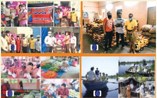
7వ పేజీ చూడండి...

అలాగే ఈ కరోనా విపత్తు వేళ కూడా దేశవ్యాప్తంగా ఆర్ ఎస్ ఎస్ తన సేవా కార్యక్రమాలను కొనసాగిస్తూ ఉన్నది. కులమతాలకు అతీతంగా అవసరమైన ప్రతి ఒక్కరికీ ఆర్ ఎస్ ఎస్ సహాయం